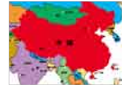
参观 China Sourcing Fair, 接触中国乃至整个亚洲极具竞争力的供应商