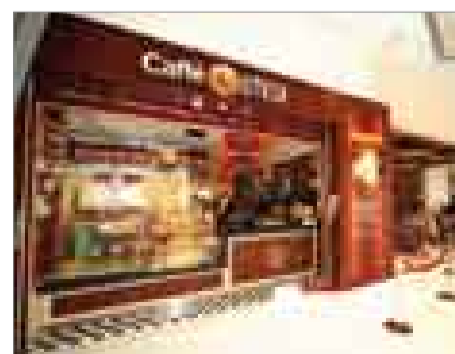
各类西方及亚洲美食餐厅