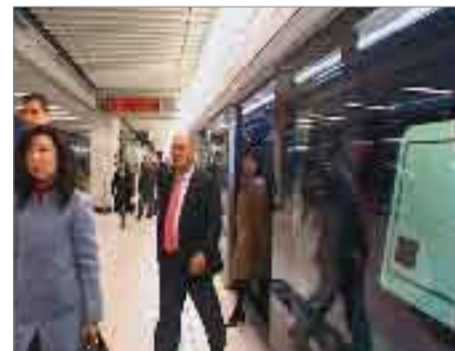
展馆内部即设有机场快线车站